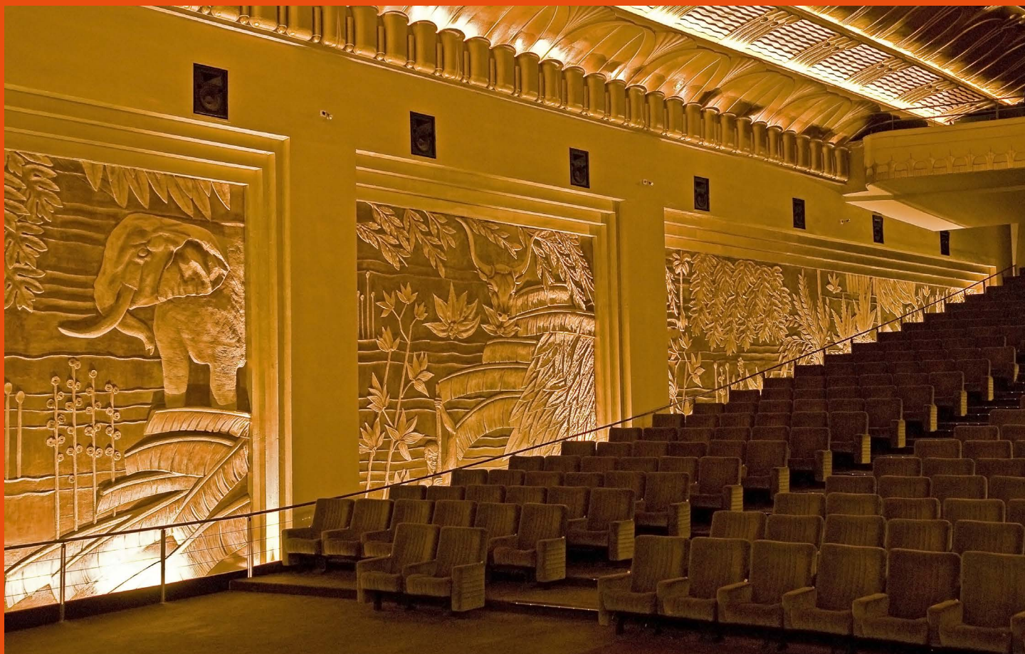
Grand Eldorado Zaal, A. de Ville de Goyet © urban.brussels

Het evenement wordt georganiseerd door het consortium “Art Deco at Home”, bestaande uit de Brussels Art Deco Society, de Boghossianstichting – Villa Empain, het van Buuren Museum & Tuinen, Huis Autrique en het Hortamuseum.