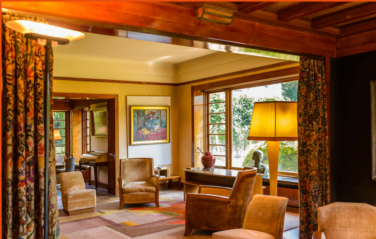
Van Buuren Museum & Tuinen

Het Brussels gewest heeft een uniek art-deco-erfgoed, dat al even gevarieerd is als de smaak van de mensen die er destijds opdracht toe gaven. Soms discreet, soms monumentaal, van een gekartelde kroonlijst op een appartementsgebouw tot enorme villa's met zwembaden, de straten van Brussel wemelen van de schatten die (opnieuw) ontdekt kunnen worden.