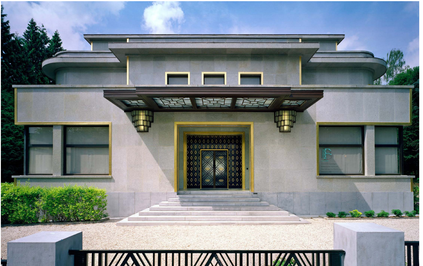
Villa Empain – Boghossianstichting