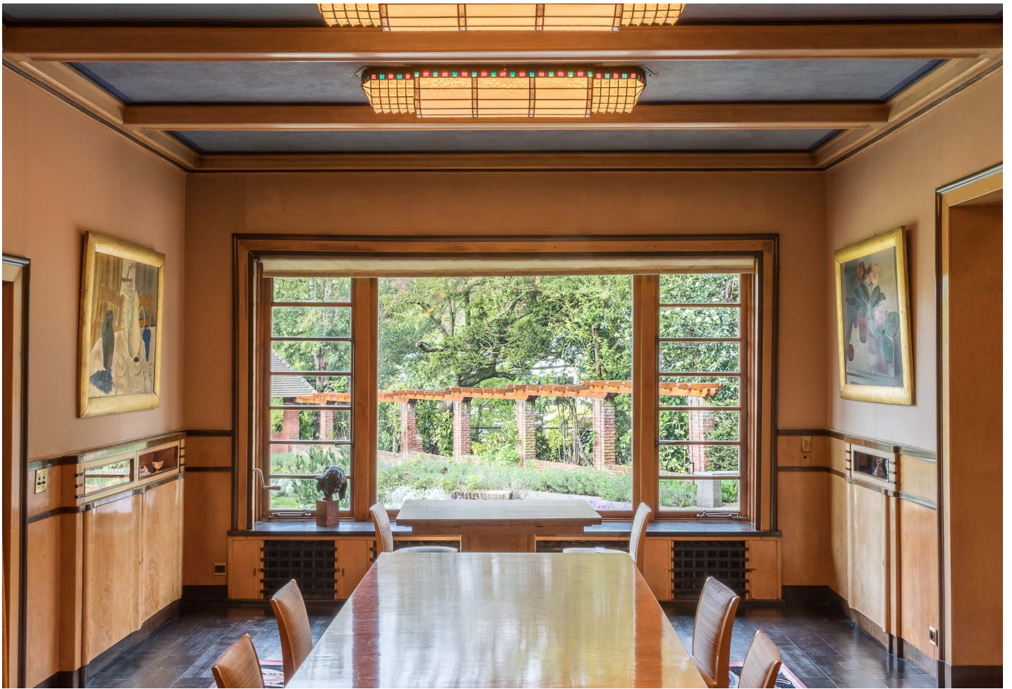
Van Buuren Museum & Tuinen